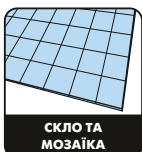
СКЛО ТА МОЗАІКА