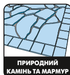
ПРИРОДНИЙ КАМІНЬ ТА МАРМУР